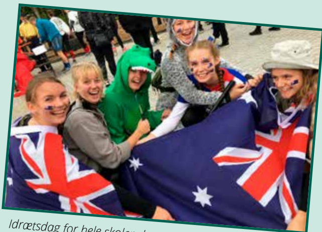
Idrætsdag for hele skolen, hvor klasserne klæder sig ud og dyster i mange discipliner.