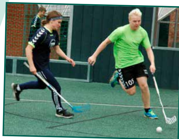
Idrætsstævner mod andre gymnasier.