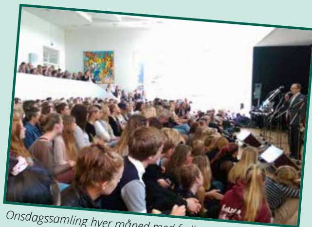
Onsdagssamling hver måned med fællessang, info og underholdning, som klasserne står for på skift.