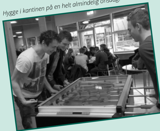
Hygge i kantinen på en helt almindelig onsdag.