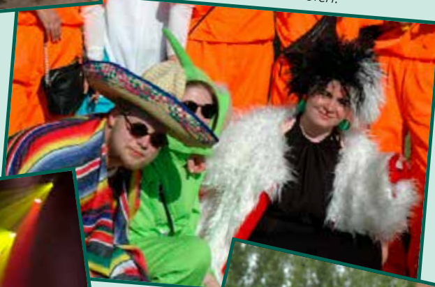
3.g'ernes sidste skoledag med underholdning for hele skolen.