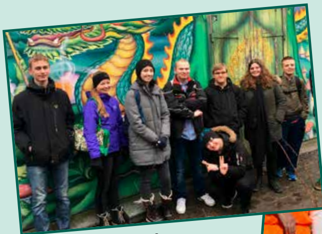
Klassetur til København i 3.g.