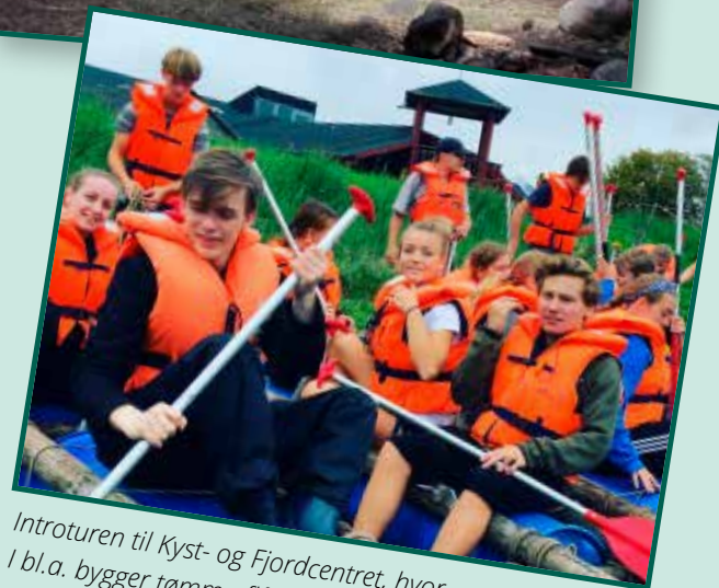
Introturen til Kyst- og Fjordcentret, hvor I bl.a. bygger tømmerflåder og laver mad på båd.