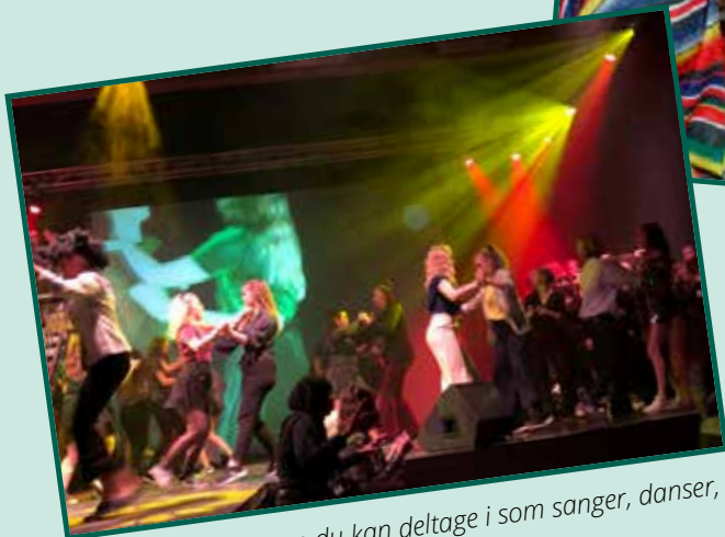
Skoleforestilling, som du kan deltage i som sanger, danser, musiker eller scenograf.